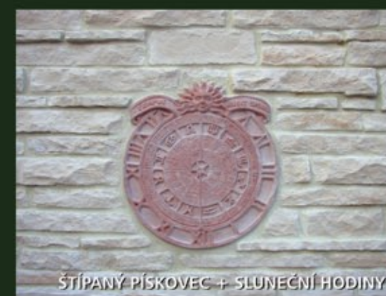
ŠTÍPANÝ PÍSKOVEC + SLUNEČNÍ HODINY