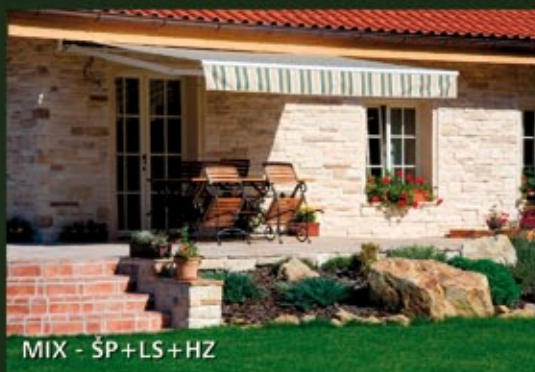
MIX - ŠP+LS+HZ