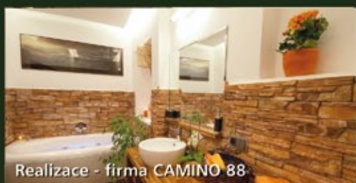
Realizace - firma CAMINO 88